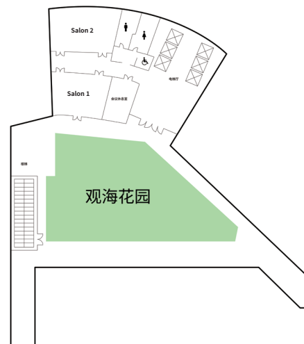
酒店3楼 – 观海花园